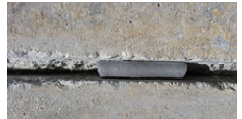
Réfection de parois en béton armé