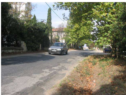
Tronçon central avant aménagement